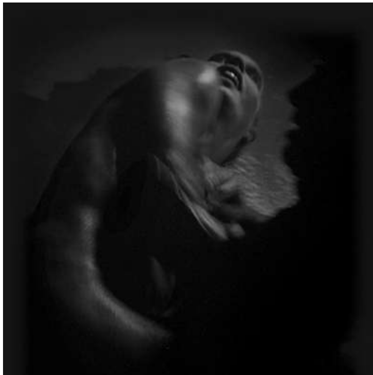
les guenilles edwarda